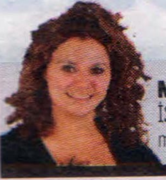
MİNE TUDUK İSTANBUL

Erdoğan sayesinde ünlü olan altın çilek fiyat artışında gerçek altını solladı. Üniversiteler bile altın çilek üretiyor.