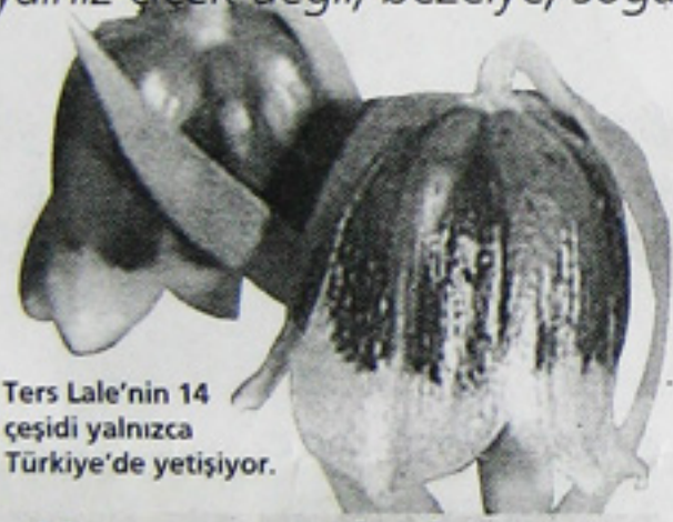
Ters Lale'nin 14 çeşidi yalnızca Türkiye'de yetişiyor.