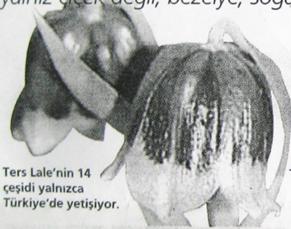
Ters Lale'nin 14 çeşidi yalnızca Türkiye'de yetişiyor.

ülkemiz olan bu çeşitleri ithal etmek zorunda kaldığımız dikkat çekti.